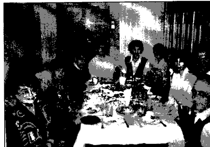
Отмечается очередной успех участника научного семинара, 1996 г.