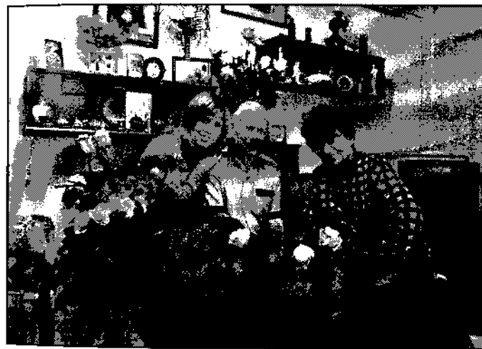
После юбилея, ноябрь 2008 г.