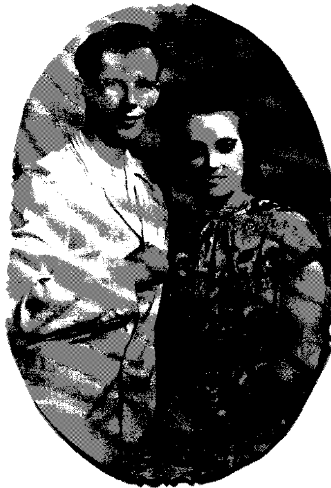
1952 г. Впереди 60 лет совместной жизни