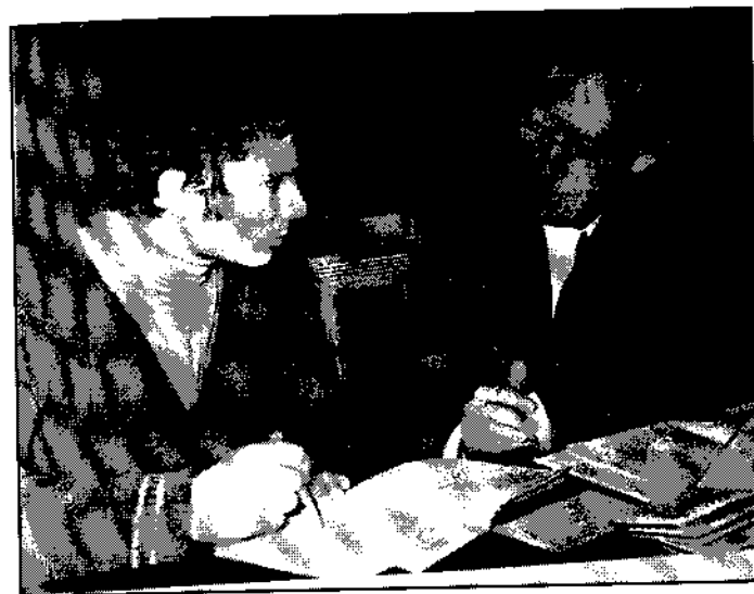
Ю.М. принимает экзамен у студента из ГДР.

Около 30 лет проработал Ю.М. Шмандин на кафедре алгебры и теории чисел. На 8 марта сотрудницам кафедры часто писали поздравления в стихах. Некоторые из них, написанные Ю.М.: